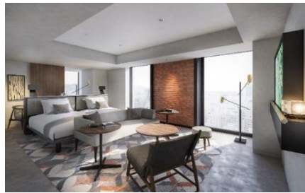
スーパーリアプラス コーナーツイン