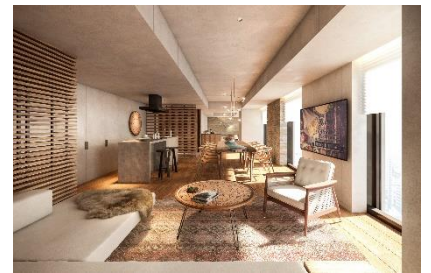
プレミアム スイート

最上階の18階には、プレミアムタイプに滞在するお客様が無料で利用できるラウンジの他、サウナ付温浴施設、ルーフトップテラスを備え、朝・昼・夜、それぞれに札幌の眺望を楽しみつつ、特別なひとときをお過ごしいただけます。