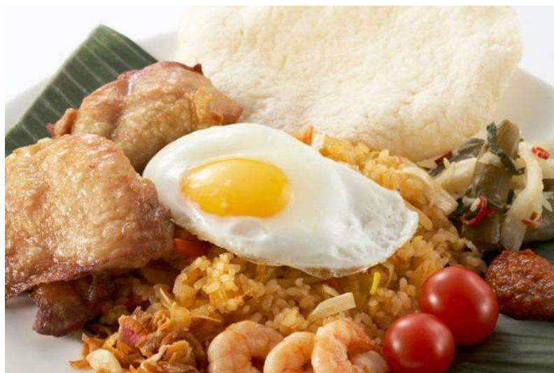
インドネシア風辛口ピラフ ナシゴレン