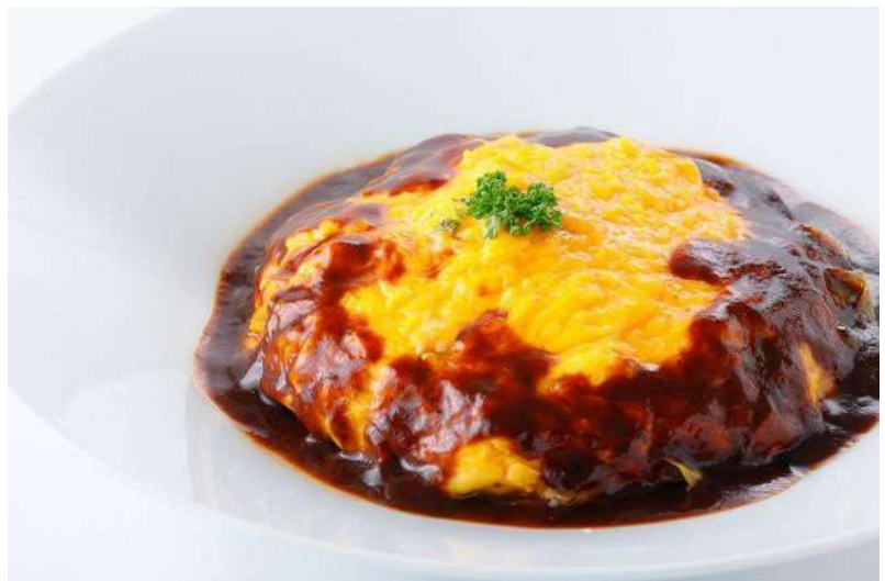
名古屋コーチン卵の親子オムライス