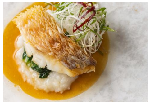
赤甘鯛の鱗煎り焼き ひやくまん穀粥と一本葱の香り