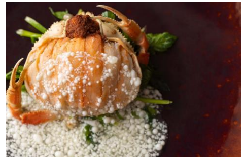
“香箱ガニ”の甲羅詰め 粒雪仕立て