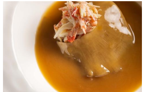
金沢港直送“加能ガニ”とふかひれ姿煮の共演