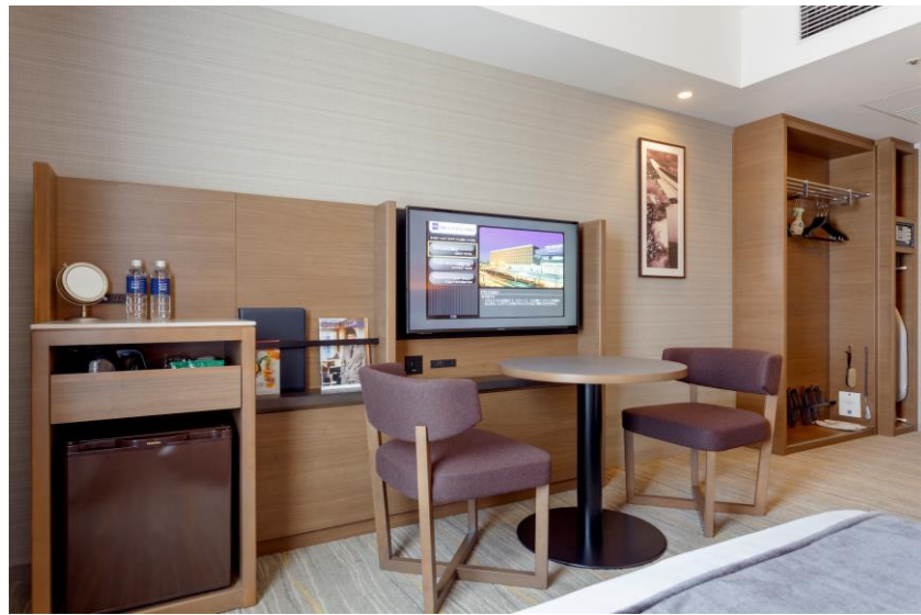
スリム化されたデスク周り・収納スペース