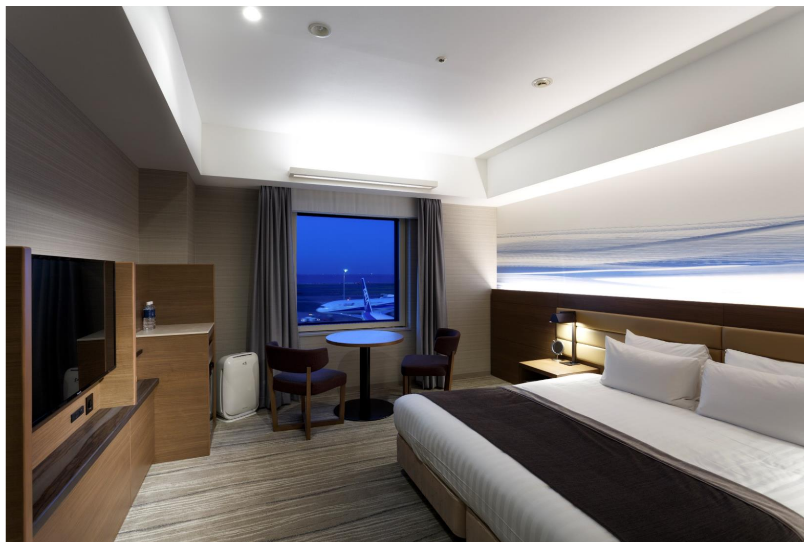
滑走路側客室 デラックスダブル

第2期工事として、2019年5月以降、4階・6階・7階の客室を着工。工事終了と同時に、全室禁煙化となる予定です。