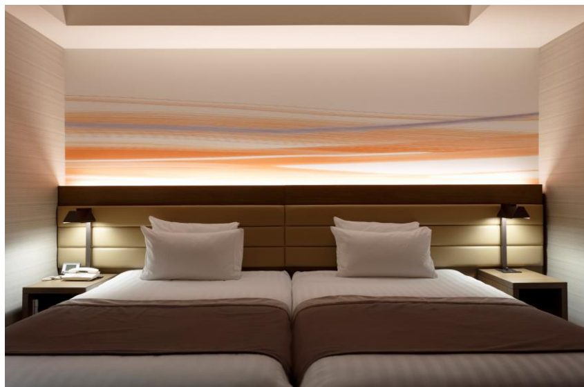
ターミナル側アクセントクロス(ハリウッドにも対応可能なヘッドボード)