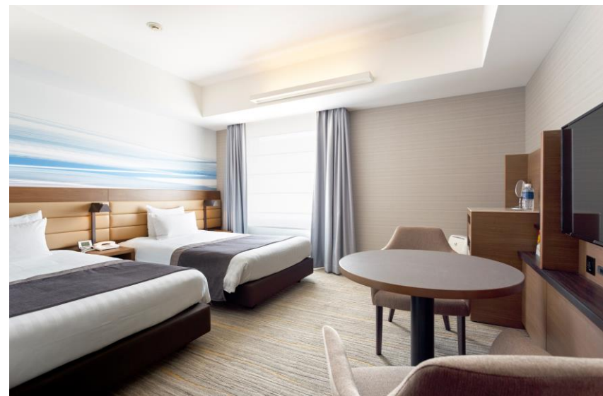
スタンダードツイン