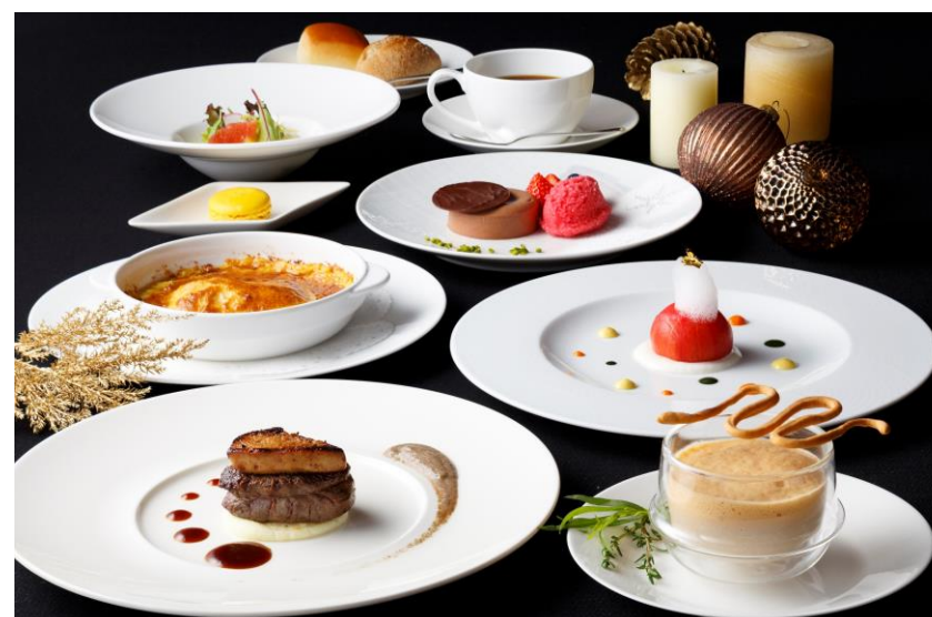
クリスマスディナー