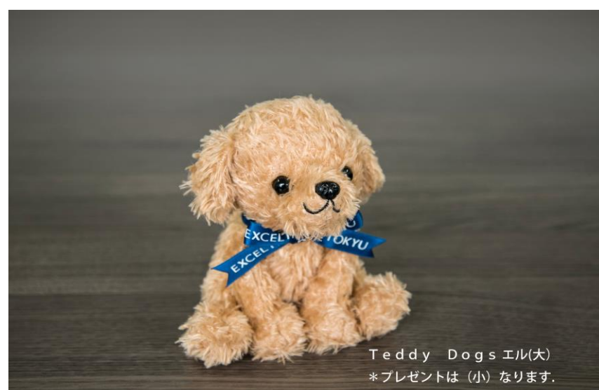
ミニクリスマスプレゼント(イメージ)