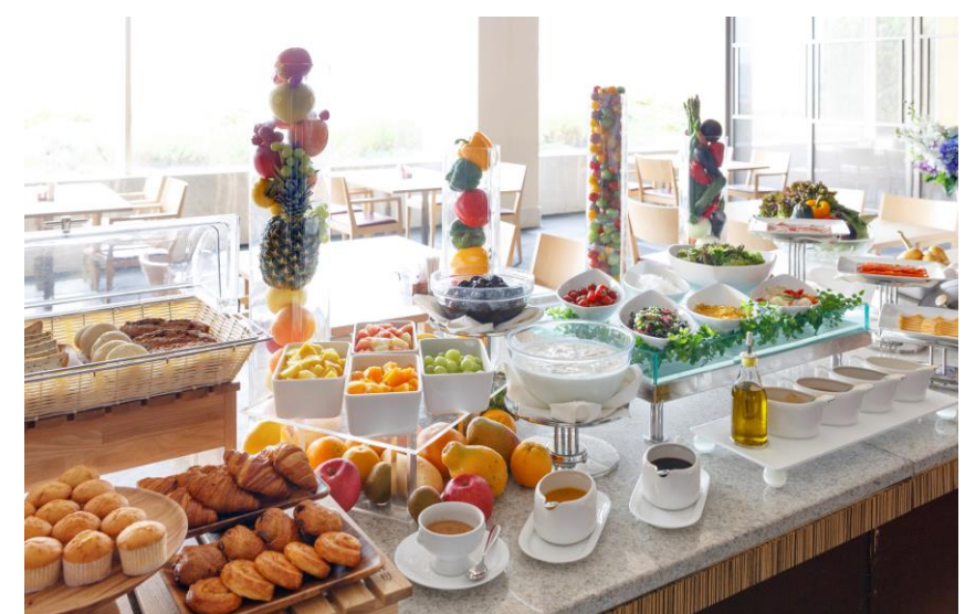
朝食ブッフェイメージ