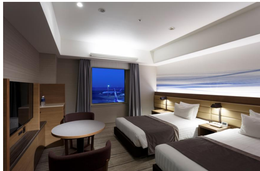
デラックスツイン(滑走路側)