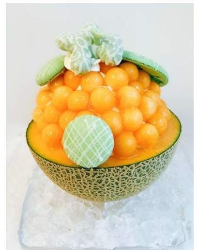
まるごとメロンパフェ