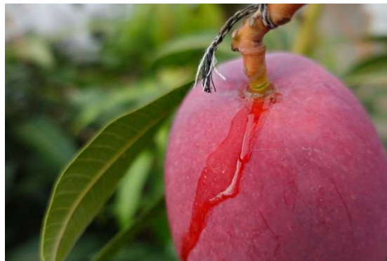
完熟マンゴ어(イメージ)

当日に採れた2種類のマンゴ어를空輸し当日中にお渡しするという産直販売は、当ホテルが羽田空港直結、川崎キングスカイフロント東急REIホテルは多摩川を挟んで羽田空港の対岸にあり車で約15分という立地と、株式会社日本産直空輸の協力により可能となりました。各産地2玉ずつのセットの他に宮古島と宮崎のマンゴ어가1玉ずつ入った食べくらべセットもご用意いたします。