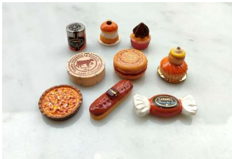
ガレットデロワの「フェーヴ」

羽田エクセルホテル東急は羽田空港第2ターミナル直結のため、新年のご挨拶やお土産として、飛行機での出発前や到着後のご利用にもおすすめです。