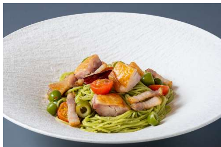
オリーブ地鶏とオリーブの浅漬けのオリーブパスタ

[内容] オリーブ地鶏とオリーブの浅漬けのオリーブパスタ 2,200 円 / オリーブ牛と茸、長ネギのクリームパスタ 山椒風味 2,200 円 / 香川本鷹を使った「さぬき蛸」といりこのペペロンチーノパスタ 2,100 円