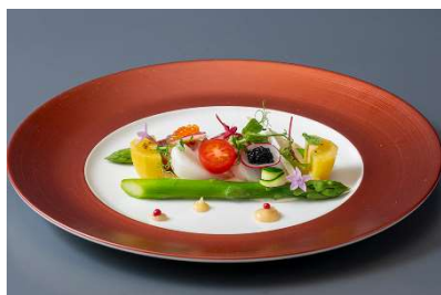
香川県で水揚げされた讃岐のタコマリネと 「さぬきのめざめ」のサラダ仕立て 瀬戸内キャビア添え