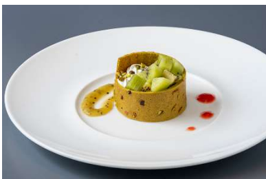
香川県産キウイのパルフェグラッセ ピスタチオのチュイル添え