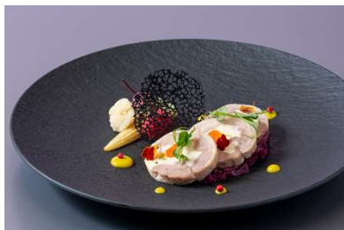
オリーブ地鶏のガランティーヌ 野菜のグレッグ添え グリーンマスタードソース