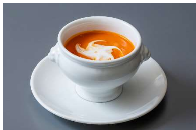
香川県産金時人参とみかんのポタージュ クリームフェットテ添え