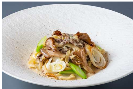
オリーブ牛と茸、長ネギのクリームパスタ 山椒風味