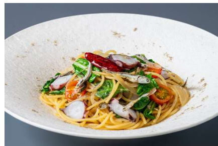
香川本鷹を使った「さぬき蛸」といりこのペペロンチーノパスタ