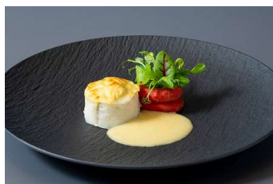
小豆島産鰹と海老、 マッシュルームのムース仕立て カレー風味のブルーブランソース