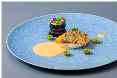
オリーブをナッペした天然鯛のポアレ 茄子とトマトのミルフィーユ添え トマト風味のヴェルモットソース