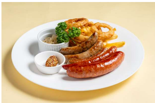
石垣島産南ぬ豚(アグー豚F1種)ソーセージ盛り合わせ