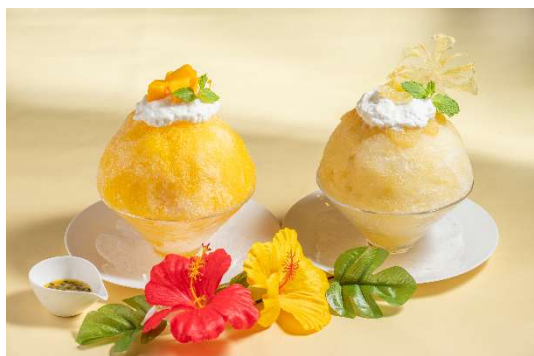
沖縄県産マンゴーのかき氷/石垣島産パイナップルのかき氷