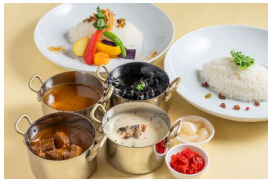
カレー(ビーフカレー/イカ墨のシーフードカレー/ベジタブルカレー/グリーンタイカレー)