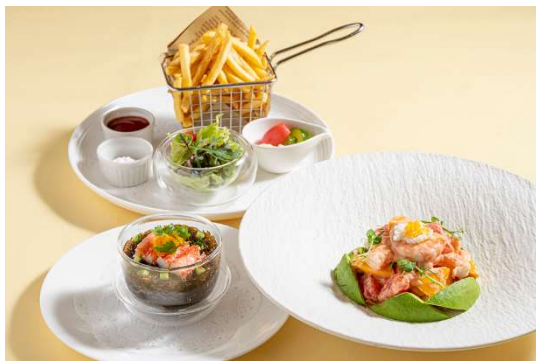
沖縄県産もずくとズワイガニの柑橘風味/海老と沖縄県産マンゴーのサラダ シークワーサーのオーロラソース/フライドポテト 宮古島雪塩フレーバーソルト