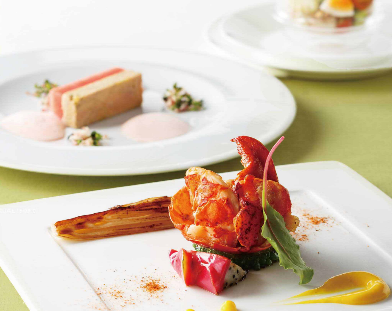
シェフのおすすめディナーコース