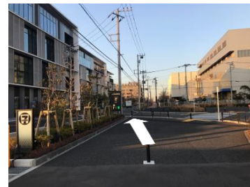
⑪セブンイレブンさんを過ぎ、「The WAREHOUSE」の建物に向かって進みます