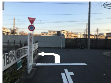
③つきあたりを左折します