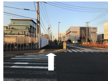
⑩信号の無い横断歩道を渡ります