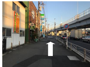
⑦ファミリーマートさん・ステーキ屋さんの前を直進