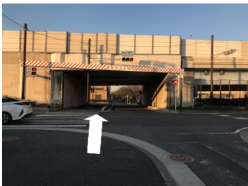
⑤横断歩道を渡り高架をくぐります