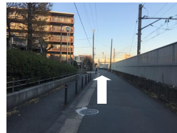
④国道409号線まで300mほど直進