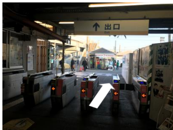
①小島新田駅改札口