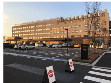
⑫ホテルへ到着です。お疲れ様でした。