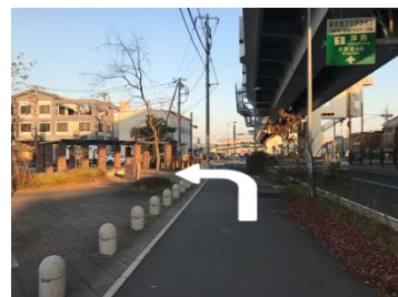
⑨「キングスカイフロント入口」交差点を左折します