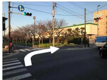
⑥横断歩道を渡って右折します