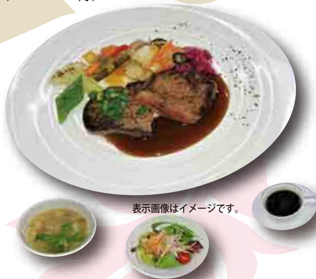
表示画像はイメージです。