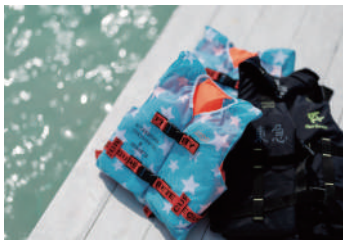
ライフジャケット