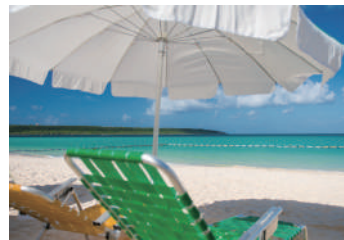
パラソル・チェアー