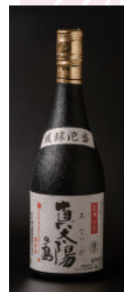
MATIDA no SHIMA