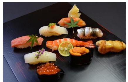
※メニューイメージ