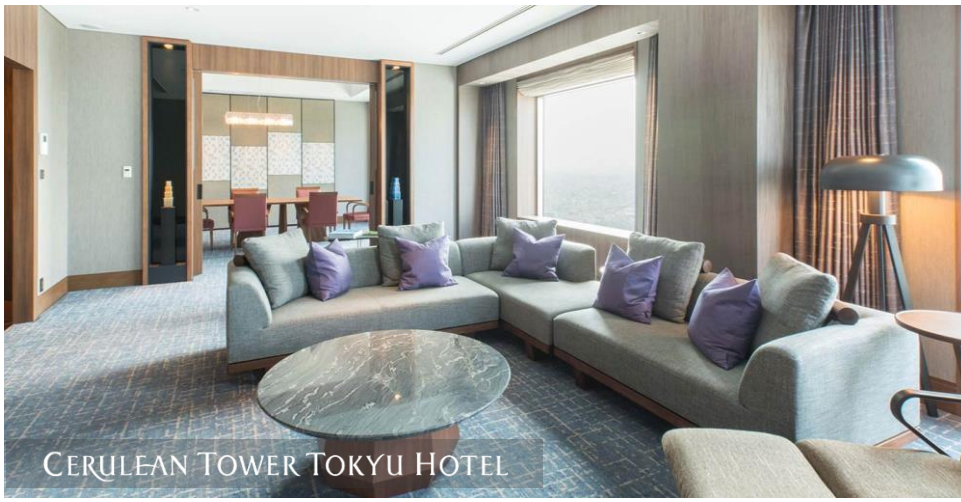
CERULEAN TOWER TOKYU HOTEL