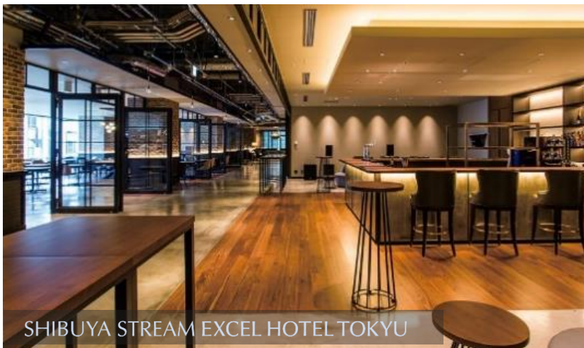
SHIBUYA STREAM EXCEL HOTEL TOKYU