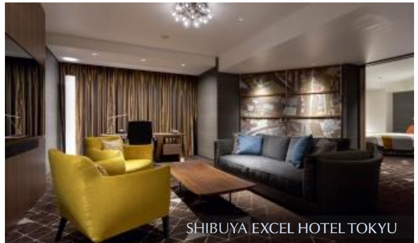
SHIBUYA EXCEL HOTEL TOKYU