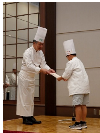
第2回のイベントの様子