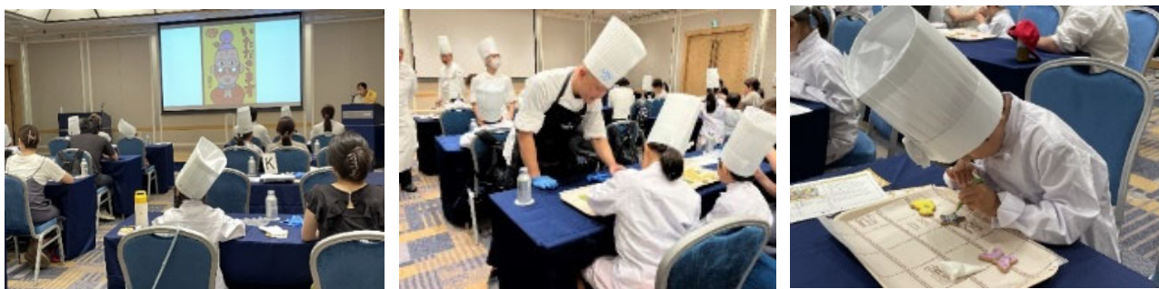
第1回のイベントの様子

お子さまたちは「もったいないばあさん」の思いを学び、クッキーづくりや味覚についての食育講座に参加。中でもクッキーづくりでは皆さま集中して取り組み、完成品を見て笑顔があふれました。夏が旬の食材である、スイカを皮まで使ったマーマレードを添えたポークリエットなど、「もったいない」をテーマにした本イベントオリジナルのコース料理もお楽しみいただきました。食への関心や感謝の心を育む、親子で学びと感動を共有した一日となりました。